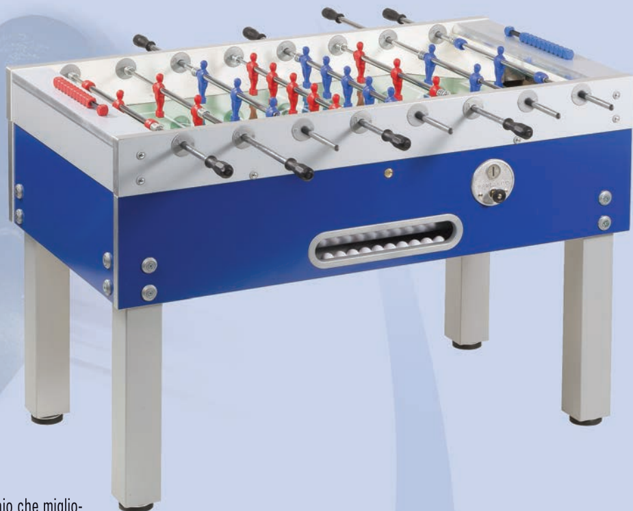
TABELLA TECNICA • TECHNICAL CHART • TECHNISCHE TABELLE

11 10 palline bianche "Standard" in dotazione.